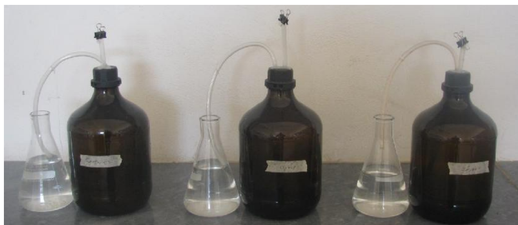
شکل ۱- رآکتورهای دست‌ساز برای بی‌هوازی نمودن اولیه مواد