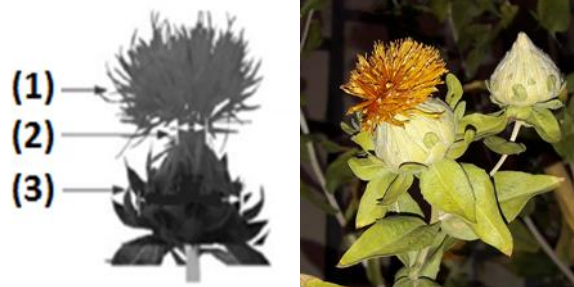
شکل ۱- قسمت‌های مختلف گل گلرنگ؛ گلبرگ (۱)، گردن (۲) و نهنج (۳) Fig.1. Different parts of safflower; Petals (1), Neck (2) and Receptacle (3)

اجزای تشکیل دهنده گل گلرنگ شامل گلبرگ، گردن و نهنج می‌باشد که از دانه‌های روغنی داخل نهنج به منظور تولید روغن