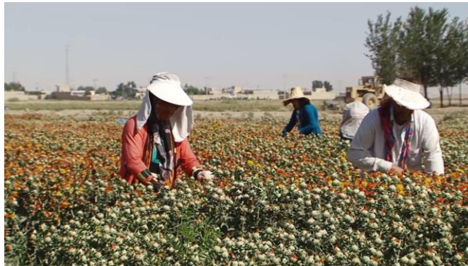
شکل ۲- برداشت به روش دستی Fig.2. Manual harvesting method

مکانیزم برشی مناسبی به منظور بهبود عملکرد دستگاه مزبور، طراحی و ساخته شود (شکل ۳-الف و ج).