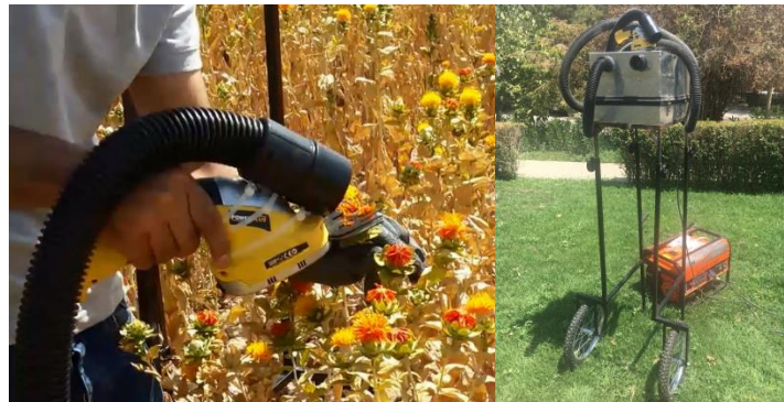
شکل ۴- ماشین فرغونی برداشت گلبرگ

در روش فرغونی از موتور برق با توان ۸kW به‌منظور راه‌اندازی واحد مکنده ۱۲۰۰W و ماشین برشی رفت و برگشتی استفاده شد.