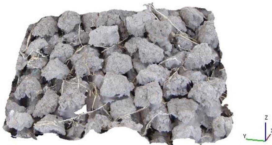
شکل ۴- یک نمونه از مدل سه‌بعدی حاصل از تصویر استریو از کلوخه‌های حاصل از شخم