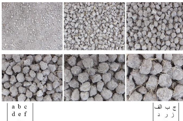
شکل ۲- نمونه‌ای از تصویر لنز چپ دوربین استریو از شش کلاس موجود: تصاویر به ترتیب از کوچک‌ترین خاک‌دانه (الف؛ ردیف بالا گوشه چپ) تا درشت‌ترین آن‌ها (ز؛ ردیف پایین گوشه راست) نمایش داده شده‌اند.