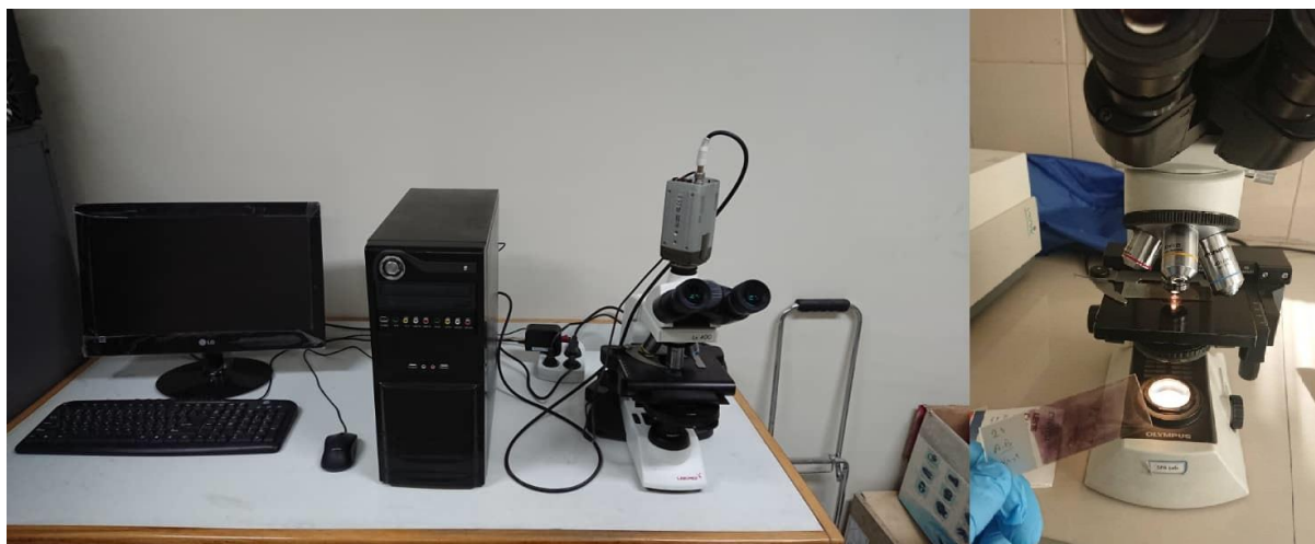
شکل ۱- دستگاه آنالیز اسپرم

سیگنال‌های صوتی خروس‌ها هر هفته یکبار توسط یک میکروفون با مشخصات ارائه شده در جدول ۱ در یک باکس شیشه‌ای دوجداره