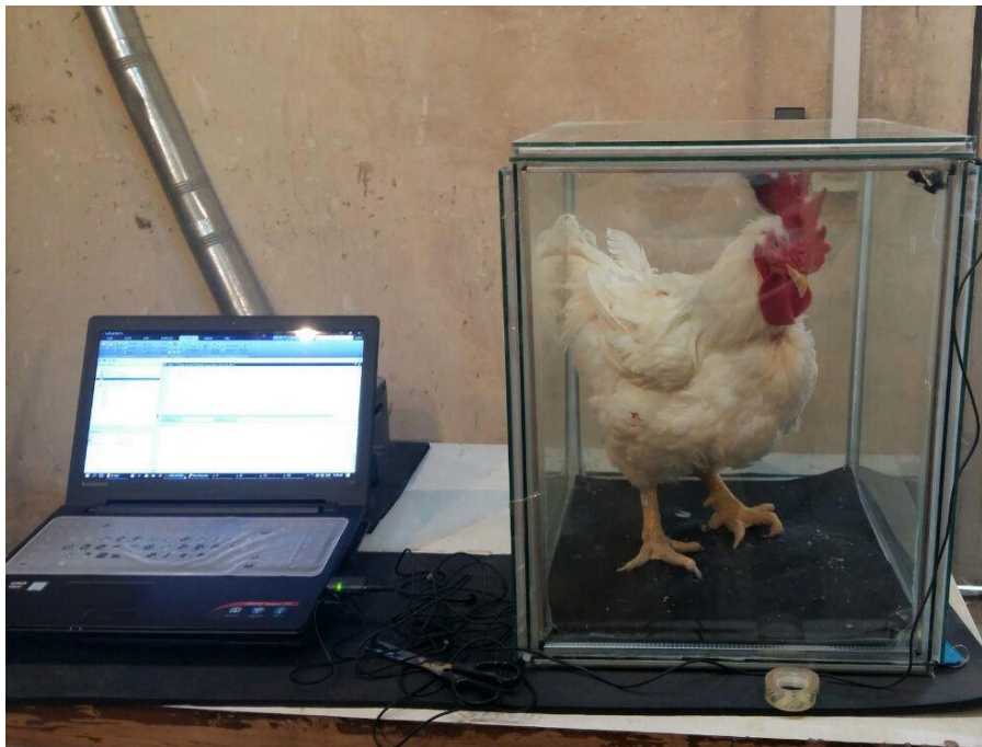
شکل ۲- نحوه ضبط صدای خروس Fig. 2. Recording the rooster sound

فاصله شهر- بلوک ۱ پیدا می‌شود. دونقطه از نزدیک‌ترین نقاط، دایره توخالی است و تنها یک دایره توپر وجود دارد بنابراین x_p به عنوان دایره توخالی طبقه‌بندی می‌شود.