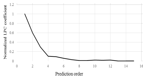
شکل ۴- نتایج تحلیل LPC

شکل ۴ نتایج ضرایب LPC را برای پانزده سفارش پیش‌بینی نشان می‌دهد. با توجه به این شکل عملکرد مشابهی با بیش از دوازده سفارش مشاهده می‌شود، بنابراین دوازده سفارش برای کاهش ابعاد ورودی انتخاب شد.