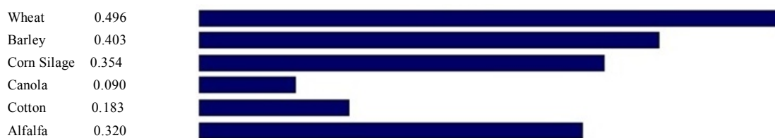
شکل ۲- نمایش گرافیکی و مقادیر ارزش‌های مطلق گزینه‌ها