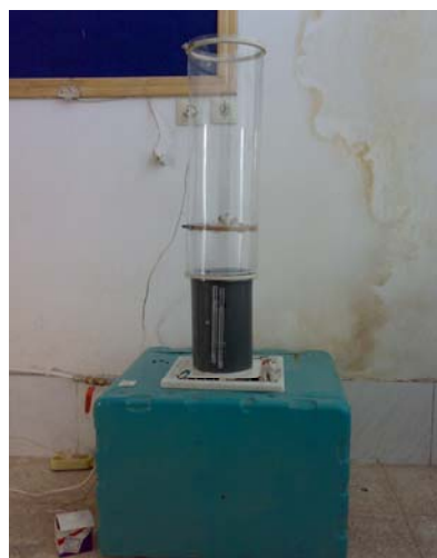
شکل ۱- دستگاه ساخته شده جهت اندازه‌گیری سرعت شناوری

برای اندازه‌گیری سرعت شناوری یک تونل باد عمودی با استوانه‌ای از طلق شفاف به‌قطر ۲۰ سانتیمتر برای مشاهده اجزاء در حال شناوری طراحی و ساخته شد. یک توری با مش 0.5 \times 0.5 در نیمه راه تونل برای قرار دادن اجزاء گل بر روی آن نصب گردید. دریچه‌ای نیز برای تغذیه طراحی شد. برای سیستم هوا دهی به‌تونل از یک فن جریان محوری با توان ۴۰۰ وات استفاده شد. چند تیغه در مسیر جریان هوا برای یکنواخت کردن هوای ورودی و جلوگیری از گردابی شدن آن در مسیر تعبیه گردید (Zewdu, 2007). سرعت هوا با دقت ۰/۱ متر بر ثانیه در تونل آزمایشی قابل تنظیم است. برای اندازه‌گیری سرعت هوا از بادسنج الکترونیکی مدل Therm 2285-2b با دقت ۰/۰۱ متر بر ثانیه استفاده شد (شکل ۱).