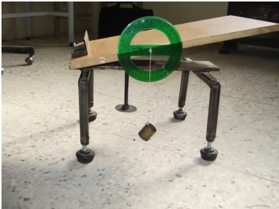
شکل ۱- سطح شیب دار بکار رفته برای اندازه گیری ضریب اصطکاک استاتیکی

یکدیگر به حالت طبیعی فراهم شود. زاویه استقرار پس از اندازه گیری ارتفاع دو نقطه شیب دار کپه و فاصله افقی بین این دو نقطه (شکل ۲ الف) و سپس جایگذاری در رابطه (۷) به دست آمد (Aviara et al. , ۲۰۰۲; Ogunjimi et al. , ۲۰۰۵):