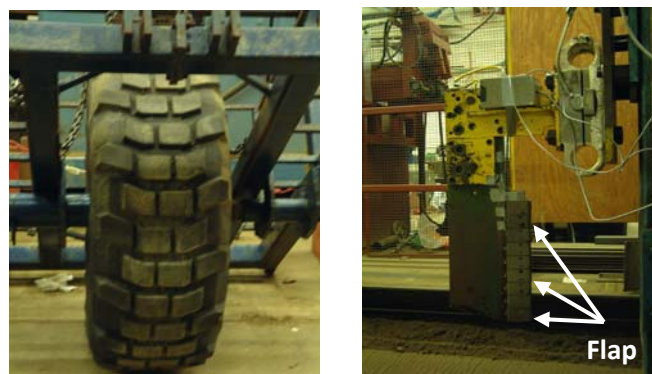
شکل ۱- حسگر نیمرخ فشردگی خاک (راست) و لاستیک سخت (چپ) Fig.1. Soil compaction profile sensor (right) and stiff tyre (left)

بارهای ۶/۳ کیلو نیوتن (۶۴۲ کیلوگرم) و ۲۳/۹ کیلو نیوتن (۲۴۴۲ کیلوگرم) و سه فشار باد ۳۲۴ کیلو پاسکال (۴۷ پوند بر اینچ مربع)، ۵۲۴ کیلو پاسکال (۷۶ پوند بر اینچ مربع) و ۷۲۴ کیلو پاسکال (۱۰۵ پوند بر اینچ مربع) بر اساس توصیه کارخانه سازنده در شرایط متفاوت خاک مزرعه ای و جاده ای خاکی انتخاب و مورد ارزیابی قرار گرفت. بار وارد بر لاستیک بوسیله قراردادن وزنه هایی بر روی طرفین شاسی حامل لاستیک تأمین گردید. خاک در رطوبت ۱۰ درصد توسط واحد آماده کننده خاک در یک مخزن خاکی با خاک لومی-شنی و با دو بار عبور غلتک تهیه شد. سپس سه خط اثر لاستیک بطور عرضی در طول مخزن به فواصل مساوی که فشردگی هر کدام بر دیگری اثر نداشته باشد، با سه فشار باد و تحت اثر دو بار ذکر شده فوق ایجاد شد